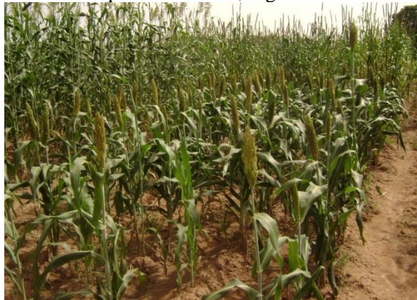
Parcelle de champs de diversité (CD) Boumboro 2009