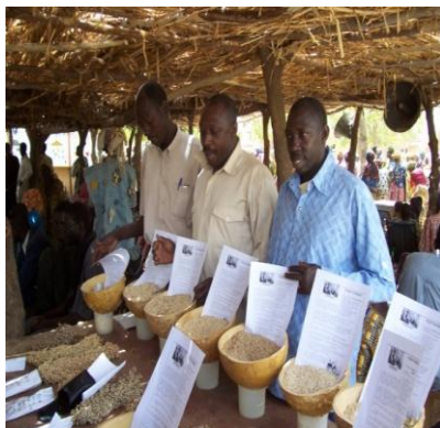
Elus de l'AOPP présentant les variétés améliorées de l'IER à la Foire de Kaniko 2005