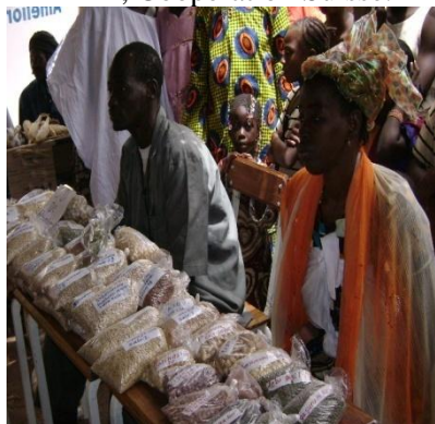
Producteurs participants foire de Sadien 2009