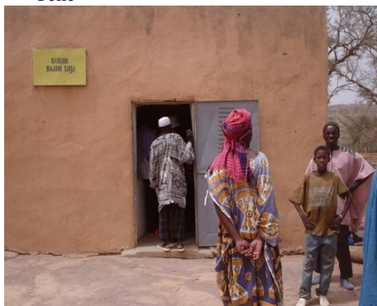
Banque communautaire de Pètaka /Douentza