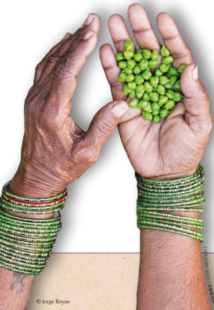
绿色扁豆 (CICER ARIETINUM)

在亚洲、非洲和加勒比地区的小农耕作系统中， 木豆 ( Cajanus cajan [L.] Huth) 作为耐旱作物，通常与谷物间作。由于木豆根深，因此不会与玉米争夺水源。