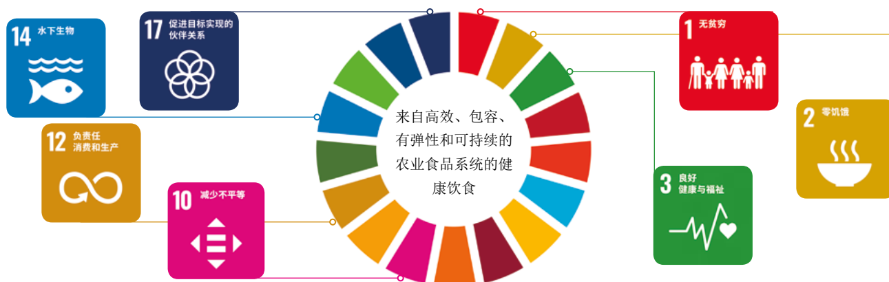
图1：粮农组织营养使命有助于实现多项可持续发展目标