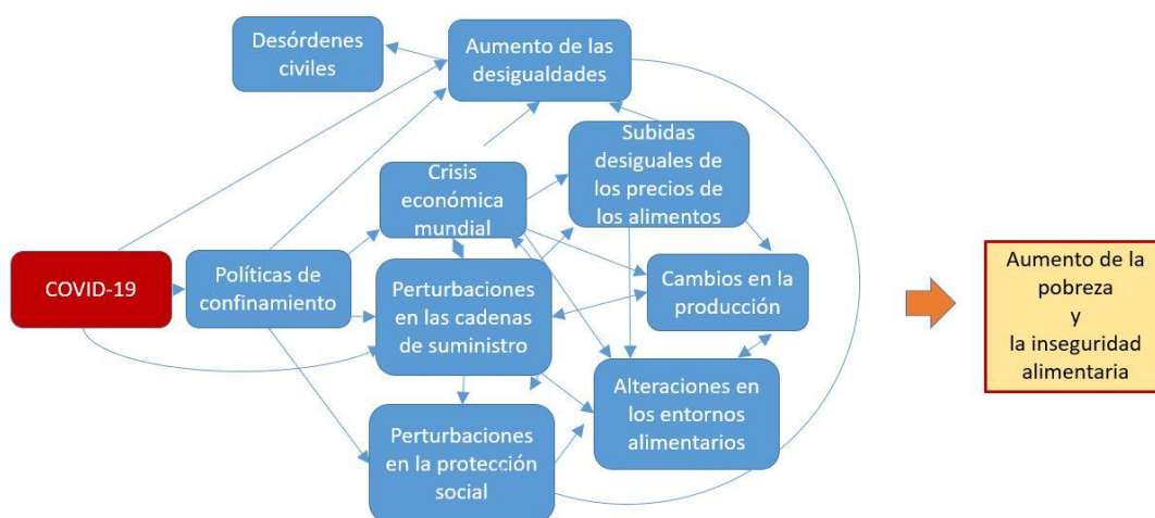
FIGURA 1. Las dinámicas de la COVID-19 que amenazan la seguridad alimentaria y la nutrición

hasta ahora se incluyen: las perturbaciones en las cadenas de suministro de alimentos; la pérdida de ingresos y medios de vida; el aumento de las desigualdades sociales; las perturbaciones en los programas de protección social; la alteración de los entornos alimentarios; y los precios más elevados y desiguales de los alimentos (véanse, por ejemplo, Klassen y Murphy, 2020; Clapp y Moseley, 2020; Laborde et al. , 2020). Además, dado el elevado grado de incertidumbre respecto al virus y su evolución —con la aparición de numerosas variantes que son más infecciosas o que causan síntomas más agudos, o ambas cosas—, puede haber amenazas futuras para la seguridad alimentaria y la nutrición, incluida la posibilidad de que disminuyan la productividad y la producción, dependiendo de la gravedad, la duración y la evolución de la pandemia y las medidas para contenerla. A continuación se ofrece un breve cuadro panorámico de estas dinámicas tal y como se han desarrollado hasta ahora, que también se describen en la Figura 1. Estos efectos han evolucionado de diferentes maneras a medida que la pandemia se ha desarrollado en el tiempo.