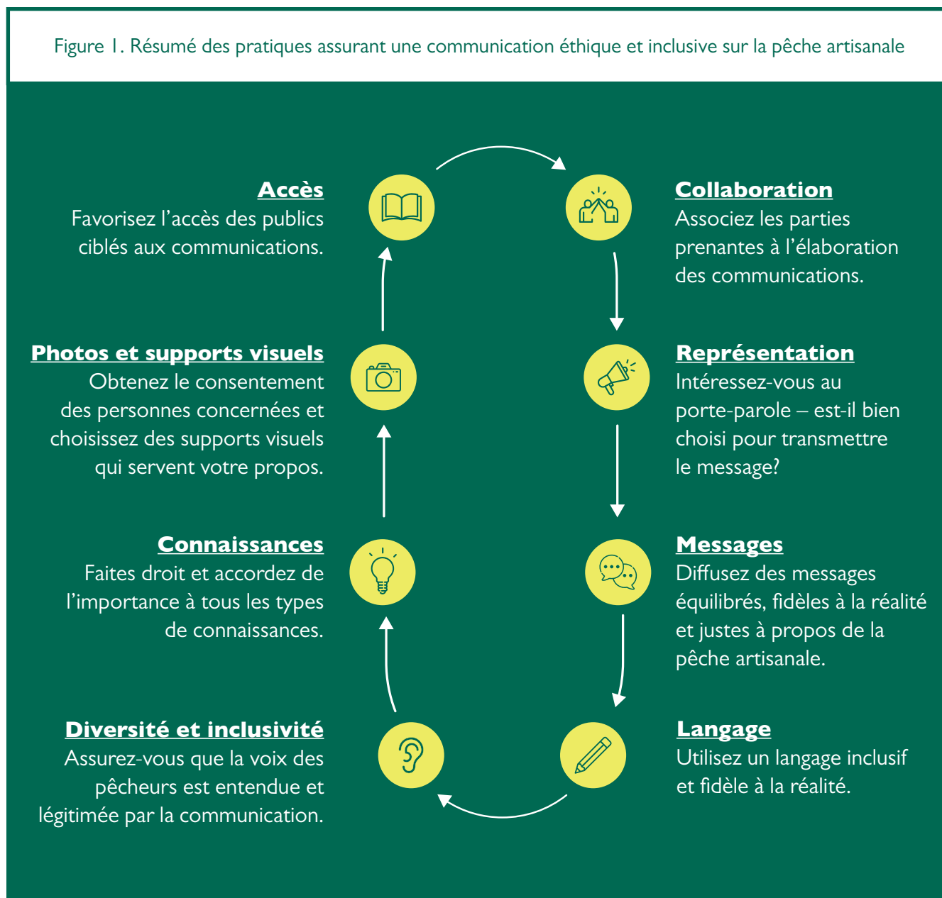
Figure 1. Résumé des pratiques assurant une communication éthique et inclusive sur la pêche artisanale

La présente section met en lumière des pratiques à adopter ou à éviter lorsqu'on communique sur la pêche artisanale ou des sujets connexes (figure 1). Ces pratiques s'appliquent à différents types d'activités et de produits de communication, vous devez donc adopter celles qui correspondent le mieux à votre situation et sont directement applicables.