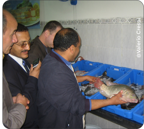
Vente de tilapia du Nil dans une poissonnerie à Ouargla, en Algérie.

Les petits producteurs d'aquaculture d'eau douce et de la pêche continentale de l'Afrique du Nord ont des difficultés à accéder aux marchés locaux et internationaux car l'environnement réglementaire est conçu pour des entreprises plus importantes. Ils manquent d'installations pour débarquer, manipuler et stocker le poisson frais, qui doit donc être vendu rapidement, avant que sa qualité ne se détériore, ce qui réduit les prix du marché et la rentabilité. Il y a également un manque de connaissances sur l'importance de suivre les bonnes pratiques pour la commercialisation du poisson. Par ailleurs, les consommateurs ont tendance à privilégier les espèces de poissons marins qui leur sont plus familières plutôt que les poissons d'eau douce qu'ils ne connaissent pas, car beaucoup d'entre eux les considèrent comme moins savoureux ou affectés par les conditions environnementales de croissance.