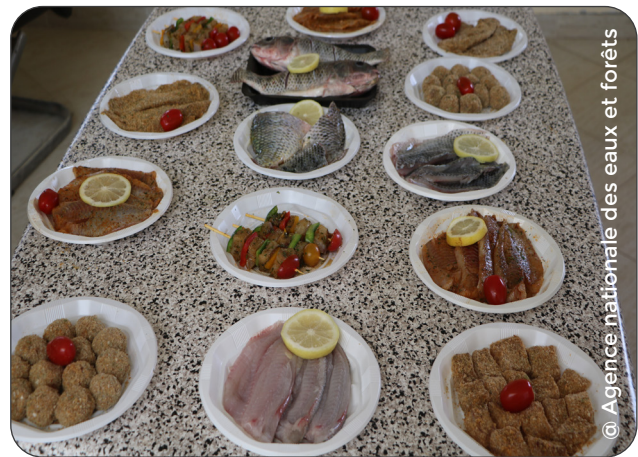
Produits à valeur ajoutée issus d'espèces de poissons d'eau douce au Maroc.

douce, en fournissant des incitations commerciales pour l'établissement d'entreprises de transformation.