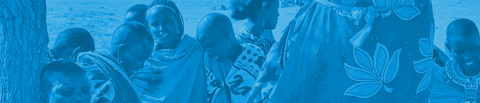
Figura 1 - Proyectos transversales