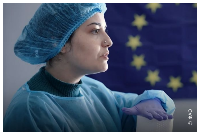
Женщины в Грузии имеют возможность получать гранты на модернизацию оборудования и помещений.

В ходе мероприятия местные женщины, производящие сельскохозяйственную продукцию, сделали сыр халлуми вместе с представителями Европейского союза, Швеции и ФАО, а также продемонстрировали тесты на определение качества молока, которые являются основными технологиями, изучаемыми в полевой школе ФАО для фермеров.