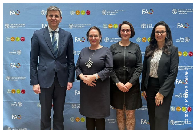
Встреча представителей ФАО и СВЖ в целях укрепления сотрудничества в области гендерного равенства.

в его связях с Cоpa-Cogeca и WEgate, а также в консультативном статусе при Экономическом и социальном совете ООН (ЭКОСОС).